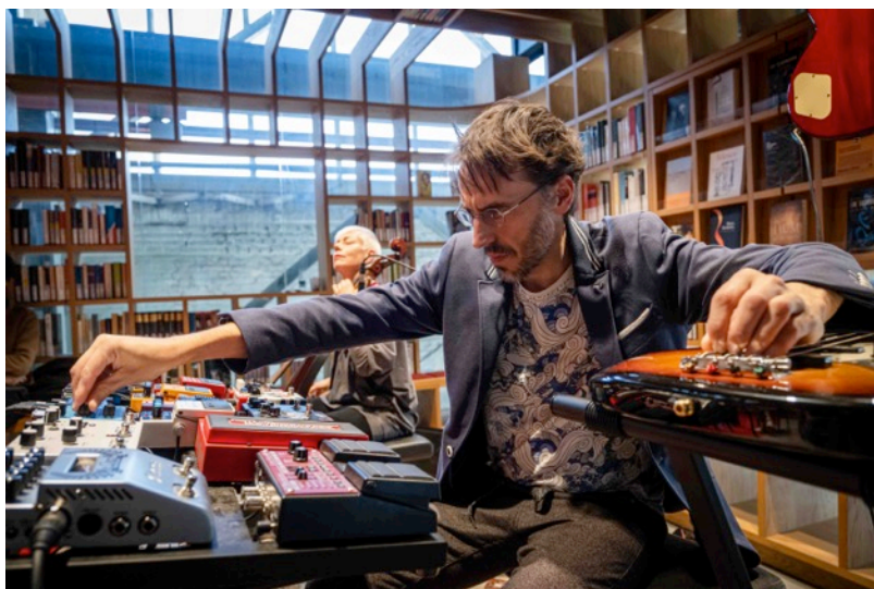
Ninth Wave op Tracking Tilburg

In 2022 maakten we een eerste versie van het project, deden we een try-out bij Dock Zuid en speelden we drie sessies op Tracking Tilburg in de Lochal.