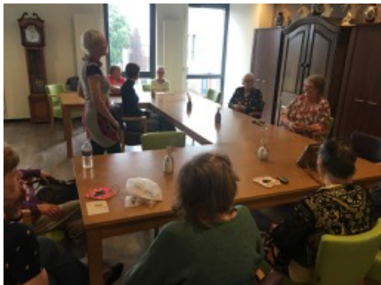
Sound & Happy on Tour bij vangnetwerkgroep en ouderengroepen van ContourdeTwern