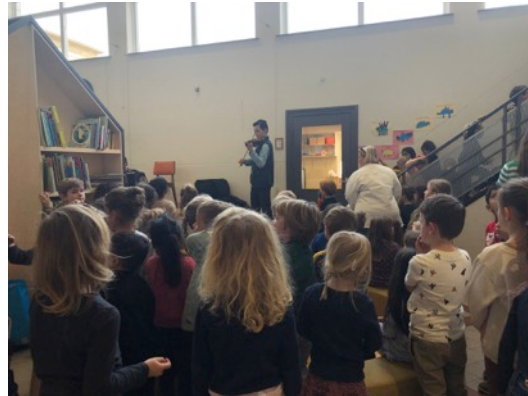
Violist Diederik van Wassenauer in het dwaalgebied en op basisschool Christoffel

De eerste editie van de Happy Bachdag was een groot succes, met zelfs media aandacht van Radio 1. Naast de oorspronkelijke partners Schouwburg Concertzaal Tilburg en Fontys AMPA, sloot ook Factorium Cultuurmakers aan door aandacht te besteden aan de dag in de eigen marketing en publiciteit. Ook faciliteerde Factorium een backstage ruimte.